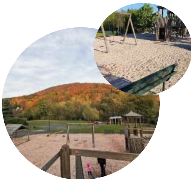
Spielplatz in Mengersgereuth Hämmern