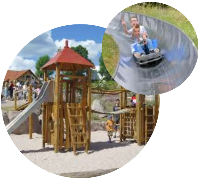
Waffenroda Freizeitpark mit Sommerrodelbahn und Restaurant