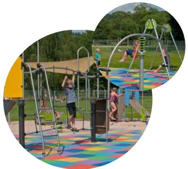
Spielplatz am Freibad Sonneberg (Mürschnitz)