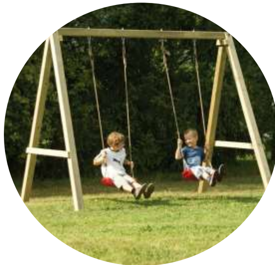
Spielplatz Steinheid an der Grundschule Steinheid (nach der Schulzeit geöffnet)