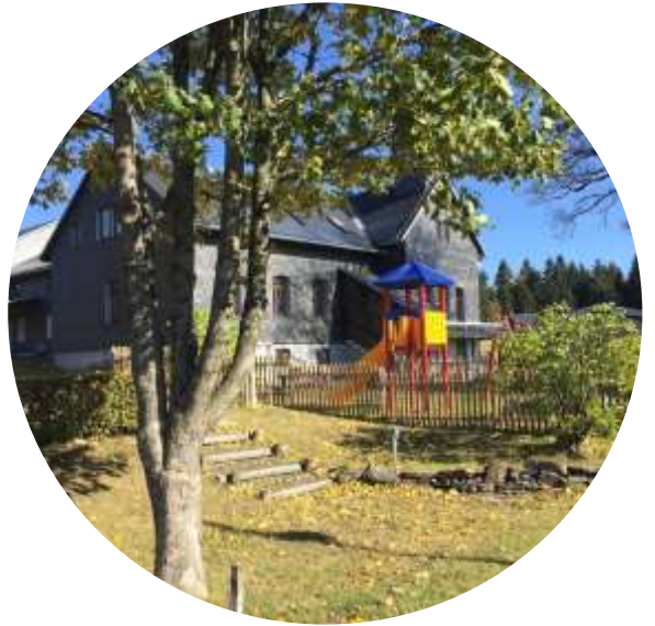
Spielplatz in Friedrichshöhe