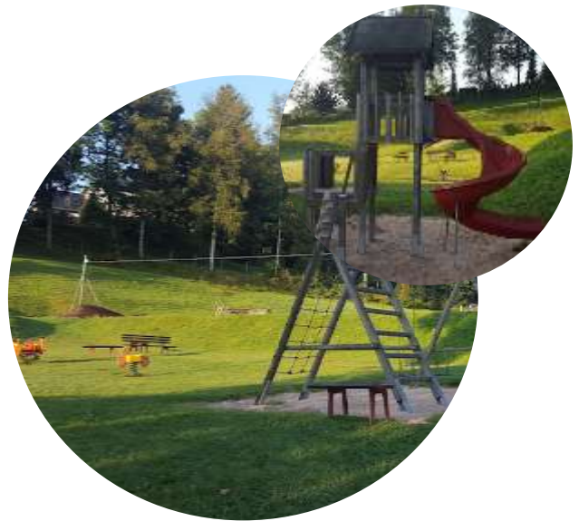
Spielplatz „Reich“ in Steinach