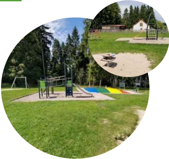
Bauspielplatz in Neuhaus am Rennweg